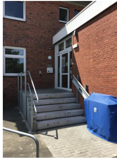
Hrsg.: Kreis Rendsburg-Eckernförde, Betreuungsbehörde; Auflg.1, 2017